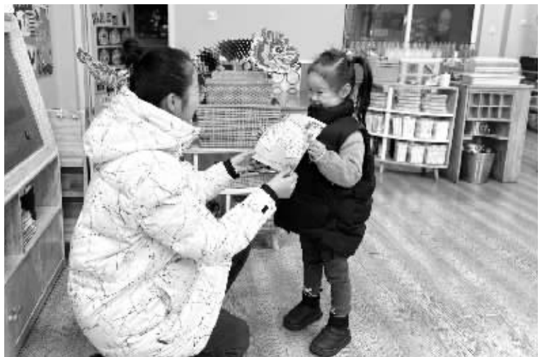
收到评语后,孩子们开心地笑了。