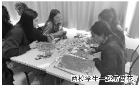
两校学生一起剪窗花。