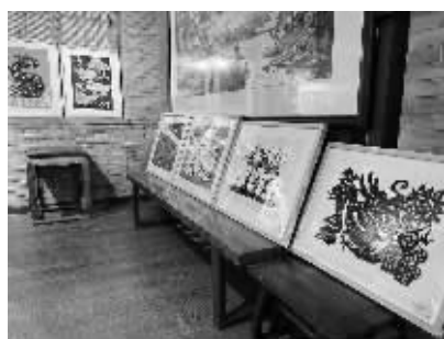
造型各异的“龙文化”剪纸作品。