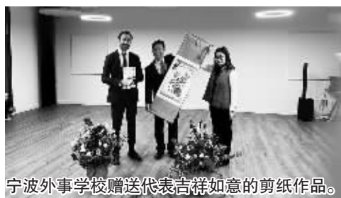
宁波外事学校赠送代表吉祥如意的剪纸作品。