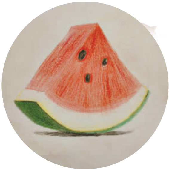
指导老师 王静亚 陈雨欣(证号2417115) 余姚市第二实验小学206班 彩铅——西瓜