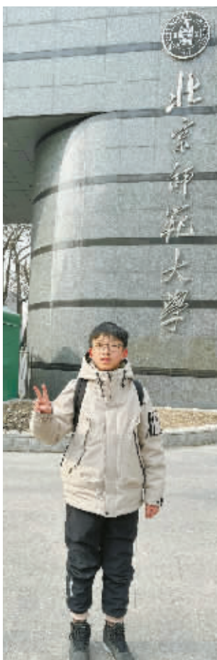
在北师大校门口打卡。