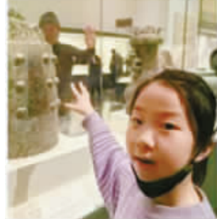
孩子兴奋地在国博拍照留念。