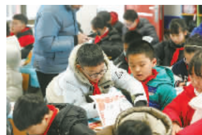
同学们正在用报纸包书皮。