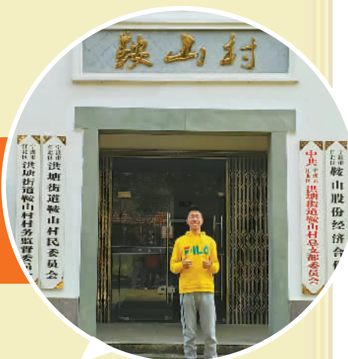
▲打卡洪塘街道鞍山村民委员会。