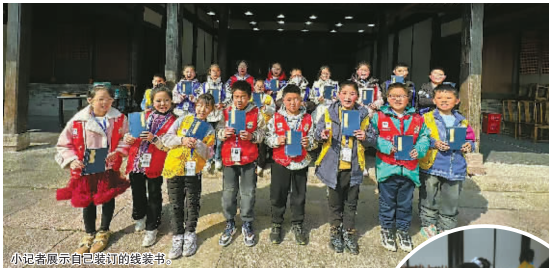
小记者展示自己装订的线装书。