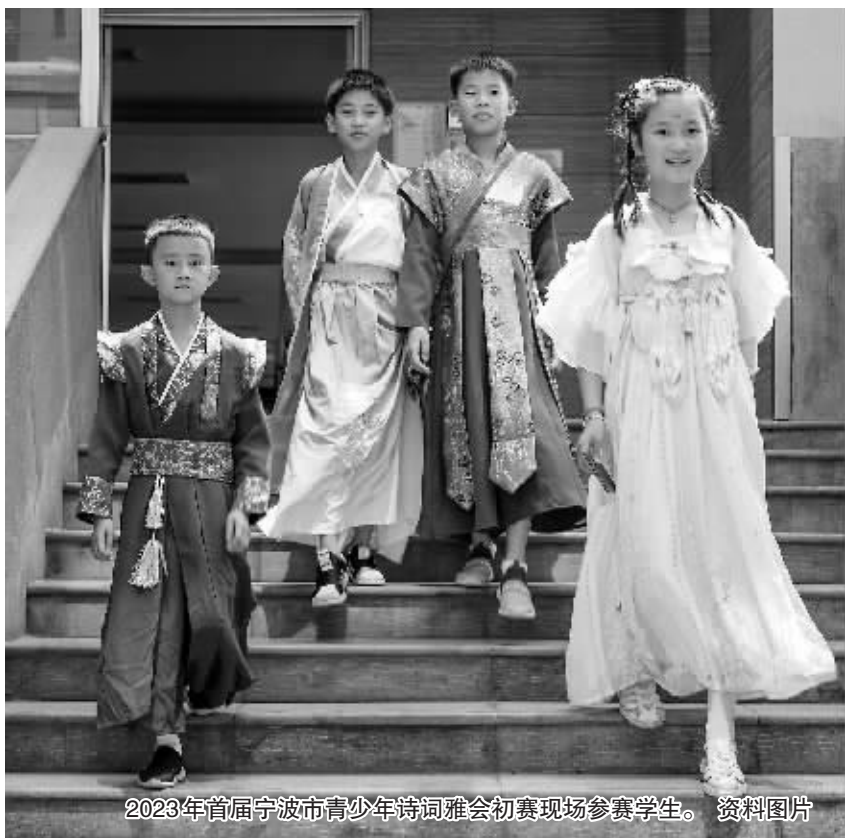
2023年首届宁波市青少年诗词雅会初赛现场参赛学生。