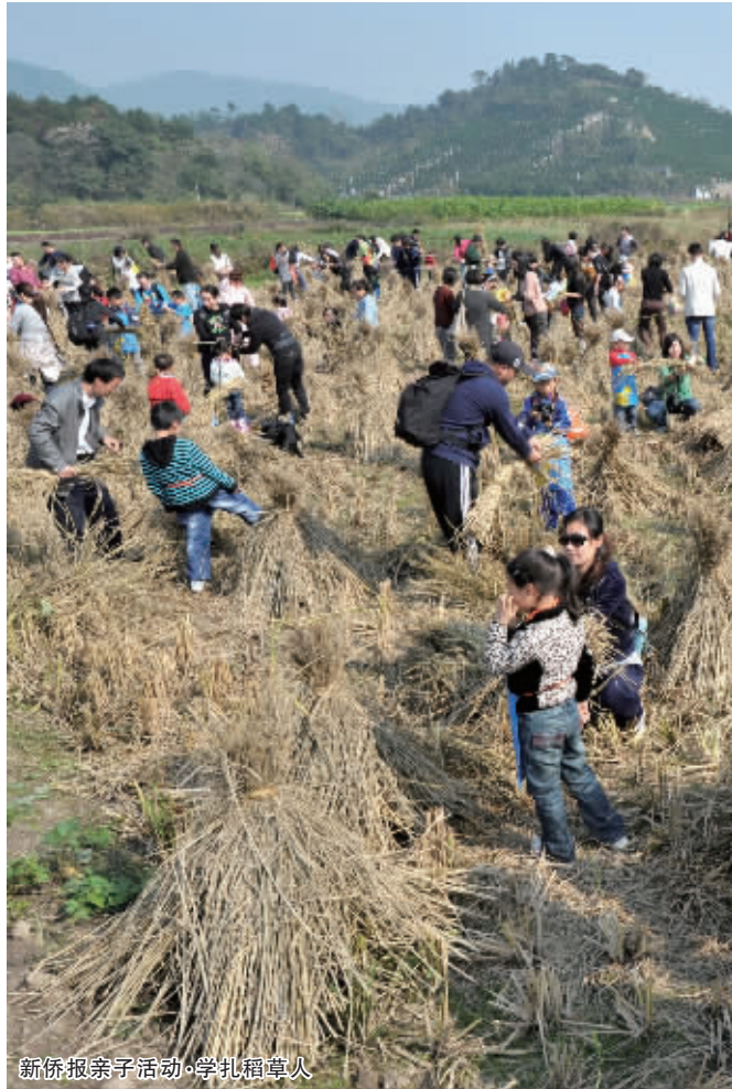
新侨报亲子活动·学扎稻草人