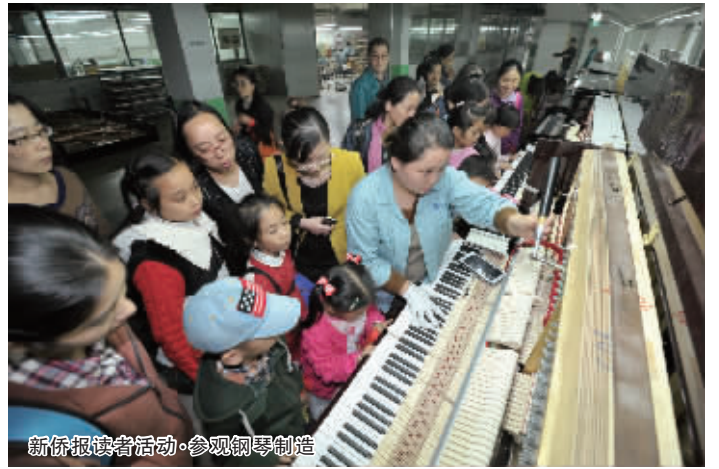
新侨报读者活动·参观钢琴制造