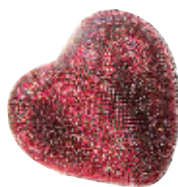
Judith Leiber 红心晚宴包

蕾丝、流苏、褶皱、水晶、白纱……虽然每一季的婚纱都离不开这几个元素，但是这绝美的一件件婚纱就是能让人这么着迷。做个美丽的新娘，是每个女孩心中最美的梦，做个时尚又美丽的新娘，更是让一辈子能去回忆的美丽事情。本期，我们为2009年秋冬即将走进婚礼殿堂的新娘们带来了秋冬最新的流行婚纱、礼服和配件。跟着它们，完成你时尚美丽新娘的梦吧。