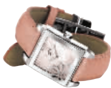
天梭 绮苑系列 粉色皮带腕表