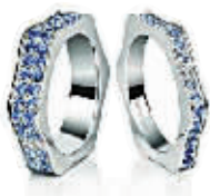
Montblanc 四季嘉年华戒指之“冬”系列