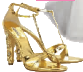
Miu Miu 金色嵌水晶高跟鞋