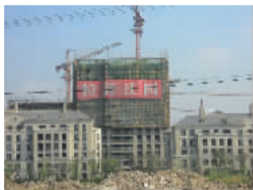
位于庄市明海大道东侧

维科·拉菲庄园位于庄市明海大道东侧，合生国际城的西面，是镇海维科开发的一个高端法式社区。拉菲庄园占地 7 万多平方米，总建筑面积约 17 万平方米，总户数共 1028 户；共有 1173 个停车位。社区由 7 幢多层洋房，6 幢小高层，4 幢高层组成。