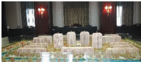
整个小区方正对称

维科·拉菲庄园在小区布局上充分考虑到每户的采光和景观，将洋房紧挨着水系，放在小区的南面，在小区的中间位置，是 4 幢 18 层的高层，在北面，分布着 6 幢 11 层的小高层，这样的布局让建筑之间互不影响，也使得空间上浑然一体又不失变化。