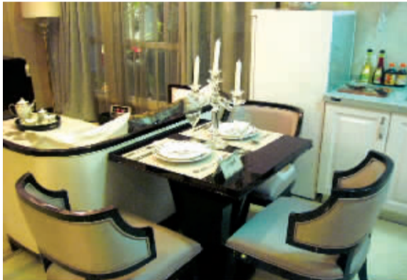
餐厅只够小两口用餐

从色调来看,这套房子选用现代简约风格普遍采用的亚克力白,橱柜的风格略有简约美式的味道,比较符合年轻人的审美观。厨壁上悬挂一个燃气热水器,记者个人不太推荐,首先占体积,对于没有接通天然气管道的房子来说,一个液化气瓶更占空间,业主应该视具体情况权衡。即热型热水器目前比较流行,技术也已经成熟,想要更省空间的业主可以考虑。