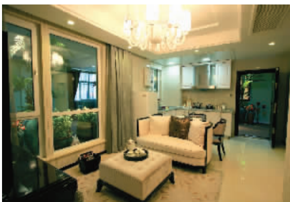
厨房、餐厅一体化设计

从空间上看,客厅和厨房连在一起,所以视觉效果上比较紧凑。尽管空间较小,样板房采用米色棉布面料的沙发使得客厅变得非常温馨。地面搭配一条米色的地毯,带简单的花纹,整个客厅在暖色灯的照射下显得整洁和温暖。