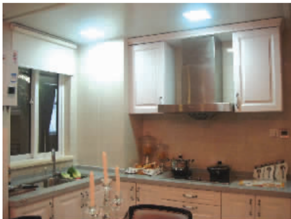
厨房功能基本够用

和美城位于宁波高新区,地段具备一定潜力,目前在售房源面积31-92平方米,主力户型73平方米。我们可以看到,和美城均为小户型房源,于去年6月开盘,曾经以高速去化率成为宁波热门楼盘。本次记者选取的样板房正是和美城73平方米的A1户型,该户型设计为三室二厅一卫。如果单是说73平方米的建筑面积有三室二厅,很多人可能会以为自己听错了。而这样的小户型,怎样充分利用面积是大家必须要仔细考虑的问题。